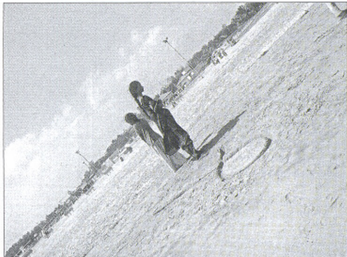
Twee meisjes tekenden het hiv-symbool in het strand op Silver Beach. India telt zes miljoen besmette mensen.