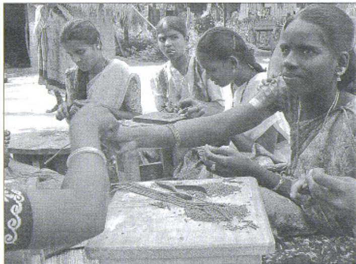
Een hele dag zwoegen om kettinkjes te maken levert deze jonge vrouwen 20 tot 25 roepies (0,40 euro) op.